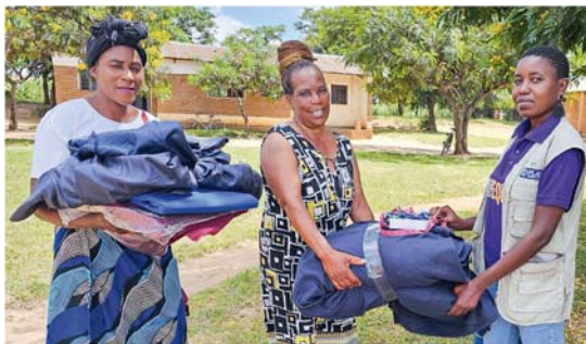
Mitglieder der Müttergruppen erhalten Stoffe, um damit wiederverwendbare Monatsbinden für Schülerinnen zu nähen.