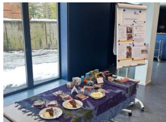
Flipchart mit Präsentation sowie Badekugeln und Lebkuchen für die Teilnehmer