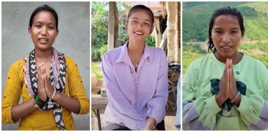
Lernen Sie drei junge Frauen kennen, die das Projekt erfolgreich begonnen haben (Link auf Videos)