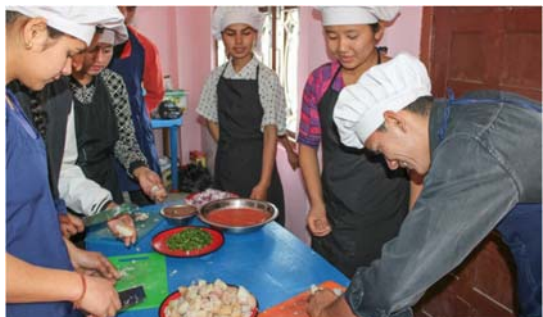
Die Projektteilnehmer:innen bei der Ausbildung zu Köchin und Koch.