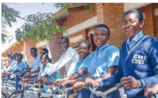
Freude über die zur Verfügung gestellten Fahrräder für die langen Schulwege.

1 Besondere Nachhaltigkeitsziele sind für uns Ziel 4 (hochwertige Bildung) und 5 (Geschlechtergleichheit)